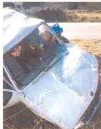
CONTACTO. Apague el motor para evitar un posible incendio.

En primer lugar, procure que su vehículo no origine un nuevo peligro para la circulación: señalice la emergencia y, si es posible, retire el coche accidentado o la carga fuera de la carre-