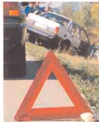
SEÑALE EL PELIGRO. Coloque la señal y retire su vehículo fuera de la calzada.