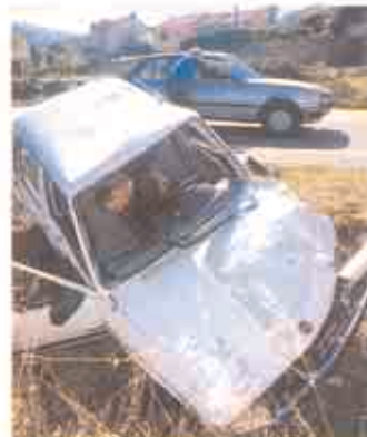
PIDA AUXILIO. A través de otros conductores y a los teléfonos de emergencia que se relacionan.