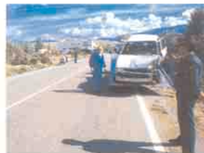
LA AYUDA. Pronto llegará ayuda sanitaria y mecánica. Póngase a disposición de los agentes para prestar declaración.