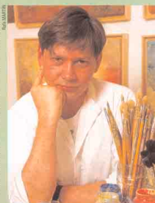
CONSEJO. Paciencia, constancia y eliminación de complejos.

Al principio pasó muchas horas sentado y pensando. Un viaje a Ibiza fue su salvación. Allí, una pintora le enseñó a pintar con puntos, el único movimiento que podía hacer con la mano. Se impuso un horario de trabajo y comenzó la lucha. Muy lentamente se fue incorporando a la sociedad. Estudió Bellas Artes, donde nadie supo nada del accidente. Vivió sólo. Se casó. Tuvo una hija. Y se introdujo en el mundo de la pintura. Ha expuesto en