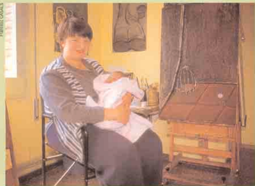
EXPLICACIÓN. Nunca prohibirá a su hija algo que ella quiso hacer, pero si le explicará las consecuencias que puede tener.