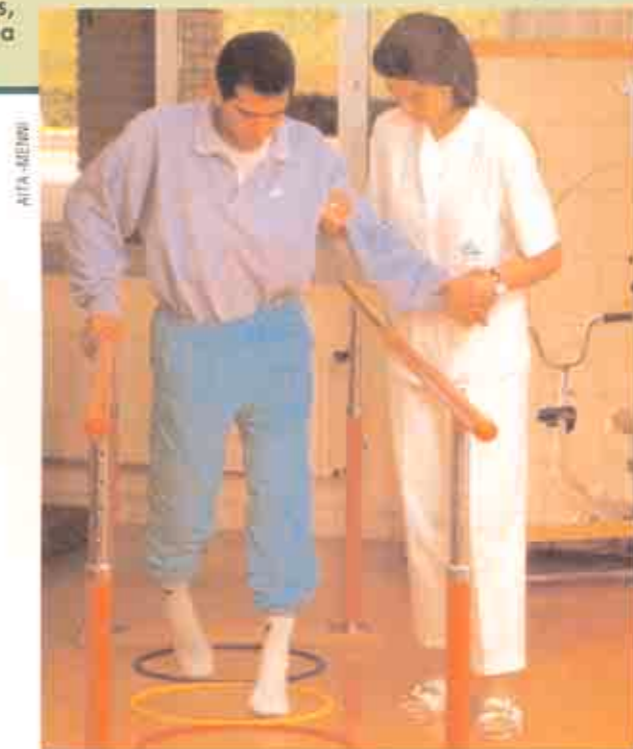
REHABILITACION: La lucha de la vida diaria.

Los problemas psíquicos resultantes de un TCE son muy diversos. Por una parte, destaca la pérdida de memoria, del lenguaje, problemas de atención y concentración, dificultades para el aprendizaje, deterioro de la capacidad de razonamiento y juicio. También pueden conllevar alteraciones emocionales como depresión, impulsividad exagerada, ansiedad, descontrol emocio-