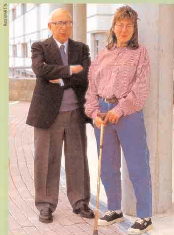
SU PADRE. El apoyo familiar es muy importante para su recuperación.

"Tenía más o menos planeado mi futuro: estudiar una carrera, mis amigas, mi novio...". Y todo eso ha desaparecido: "Mi relación con el chico, creo que así puedo