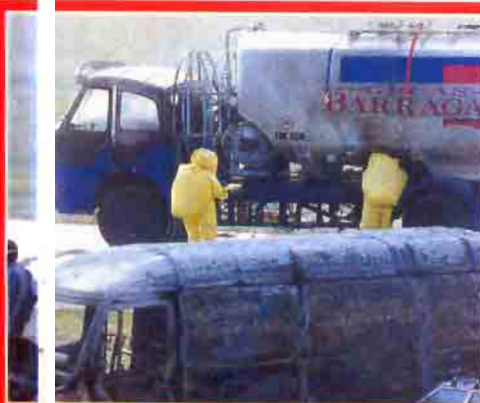
Equipos de protección química evalúan los riesgos del vertido del camión cisterna.