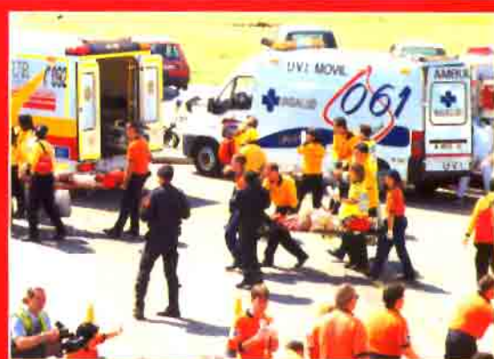
Las víctimas son trasladadas a las ambulancias que les esperan.