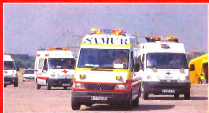
Las "norias" de ambulancias parten hacia los hospitales escoltadas por Policía Municipal y Guardia Civil.