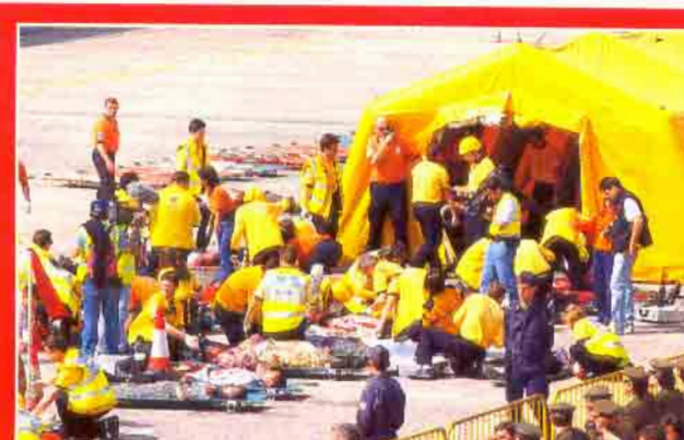
Se instala un Puesto Médico Avanzado, un "hospital de campaña" para atender las lesiones más graves y urgentes.