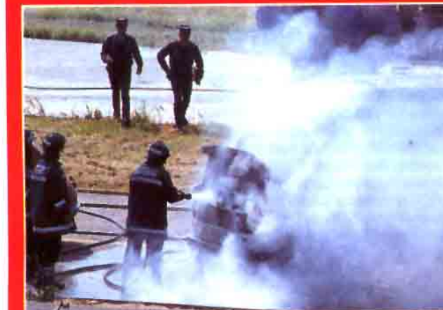
Los bomberos apagan el fuego de los vehículos. Vista la magnitud del siniestro, se piden refuerzos.

cios: médicos y ambulancias del SAMUR (servicio de emergencia sanitaria municipal) mientras los bomberos apagan las llamas que envuelven a los vehículos. Paralelamente, la Policía Municipal y la Guardia Civil acordonan la zona.