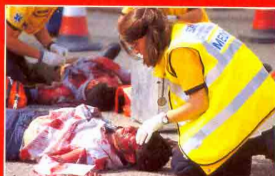
Los heridos han sido "clasificados" según su estado. Serán evacuados en función de ese parámetro.