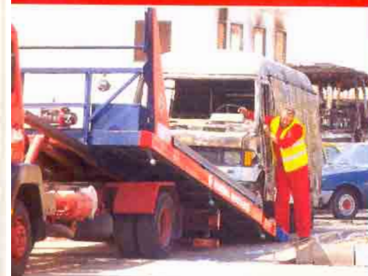
Los vehículos implicados en el suceso son retirados del lugar del siniestro en varias grúas.