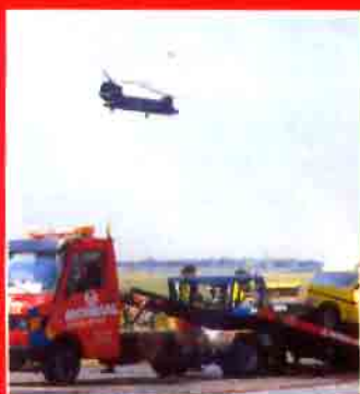
Un helicóptero de gran capacidad del Ejército de Tierra.