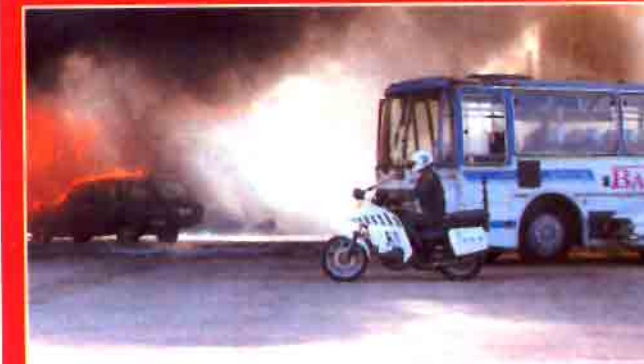
El aviso del accidente parte desde un helicóptero de la DGT. La Guardia Civil llega al lugar del suceso.