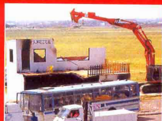
El estado del edificio afectado aconseja su demolición. Un enorme brazo mecánico se ocupa de ello.