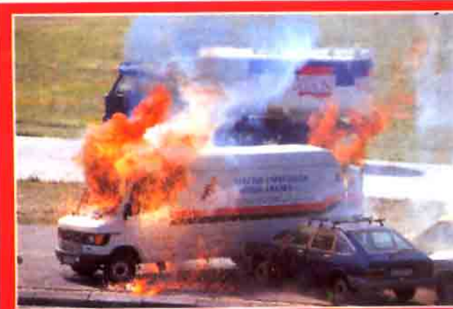
Tras una colisión múltiple y el impacto de un camión contra un restaurante, algunos vehículos empiezan a arder.

Desde el aire, un helicóptero de la DGT "encuentra" el accidente y llama a la central de emergencias del Ayuntamiento de Madrid que activa múltiples servi-