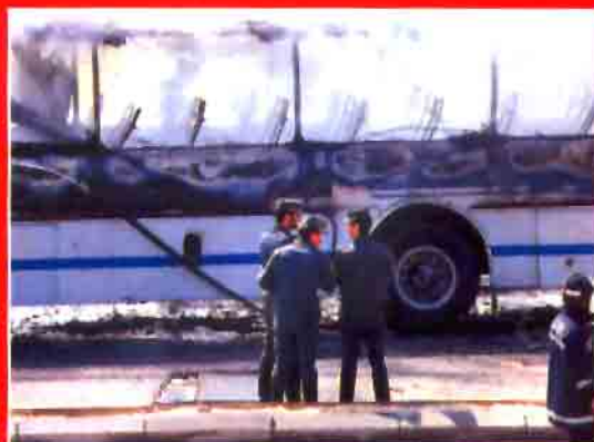
El equipo de atestados de la Guardia Civil investiga las causas del accidente.