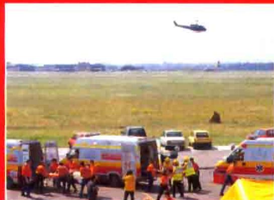
Empiezan a despegar los helicópteros en los que están siendo evacuados los heridos más graves.