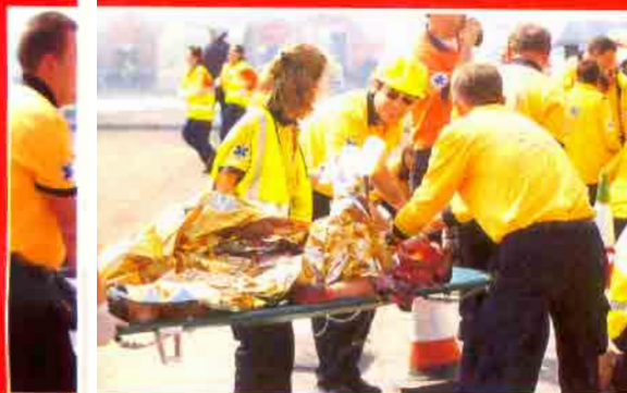
El hospital que acoge a los heridos está recibiendo, en tiempo real, imágenes de la situación.