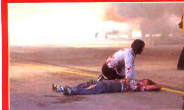
Algunos heridos han podido salir por su propio pie y ayudar a otros a abandonar el edificio y los vehículos implicados.