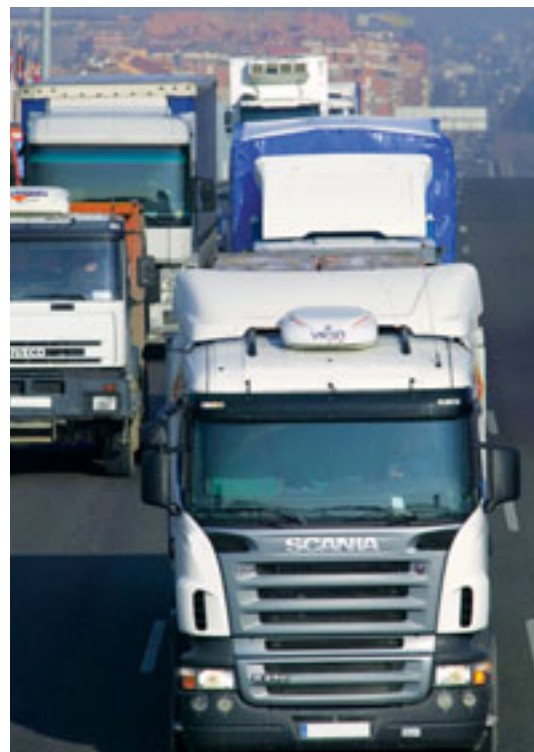
➤ Es una enfermedad frecuente entre los profesionales.