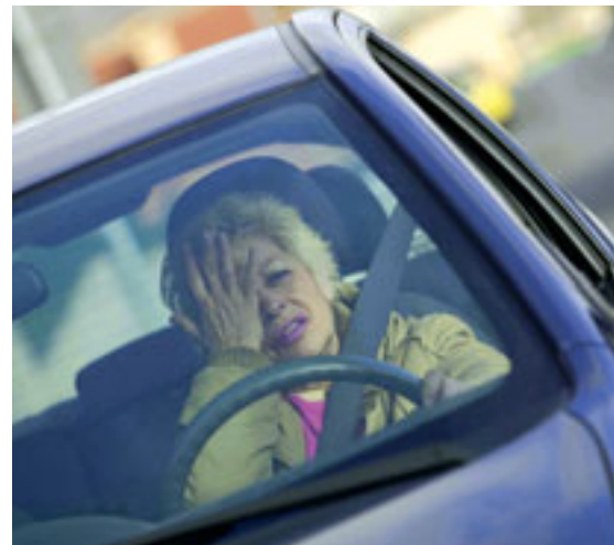
➤ Aunque, con menor frecuencia, las mujeres también pueden padecer apnea..

Asientos que vibran, agudos pitidos, volantes que se mueven... son algunos de los sistemas con los que los fabricantes de vehículos intentan evitar que los conductores se duerman. La mayoría de estos sistemas llevan una cámara integrada que enfoca los ojos del conductor y sigue sus movimientos, reconociendo el grado de atención o cansancio a través de la frecuencia y velocidad de su parpadeo, o integran sensores que captan la trayectoria del coche y avisan cuando ‘pisa’ las marcas viales. Lo último es una lámpara que emite una luz azul que, según Visteón –la empresa embarcada en este proyecto–, “inhibe la producción de melatonina, conocida como la hormona del sueño, y evita que el automovilista se duerma mientras conduce”. Los asesores médicos de la DGT advierten que todos estos sistemas plantean dudas: la mayoría actúa cuando ya se ha producido un relajamiento muscular y, por lo tanto, las aptitudes para la conducción ya se han deteriorado y, por otro lado, está la reacción que puede suscitar en el conductor la alarma. Son prometedores, añaden, pero todavía necesitan mucha experimentación y una recomendación: “Nadie puede confiarse y ponerse en manos de uno de estos dispositivos para evitar el sueño”.