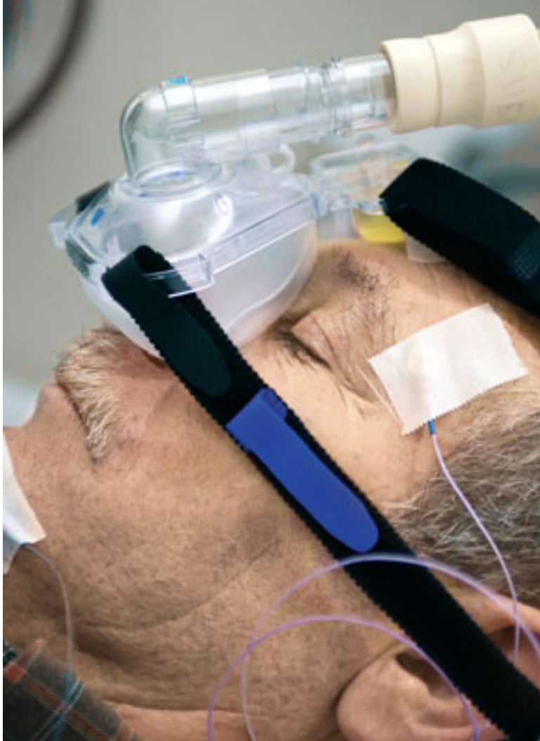
➤ El tratamiento con mascarilla nasal (CPAP) elimina los síntomas y, por ello, el riesgo.

La secuencia es más o menos repetitiva. Se comienza con bostezos, cambios de posición de las manos, nerviosismo, se modifica la distancia al vehículo que va delante, se incrementan los errores... La fijación de la mirada y de la atención se reduce paulatinamente. “Y comienza la lucha ‘casera’ contra la somnolencia” explica Elena Valdés, asesora médica de la DGT: tomar un café, un refresco, una manzana, un chicle, abrir la