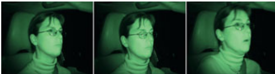
➤ Secuencia en la que se aprecia como una enferma se duerme y el 'susto' que le produce despertarse.